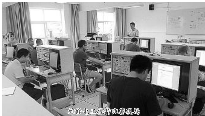
维修电工操作比赛现场

竞赛最终结果将在月底前汇总完成,分别由应知理论和应会操作两个模块汇总后得出,按照“成绩优先、综合考评”的原则,从各职业(工种)前6名选手中选取若干名选手参加集训,最终择优确定两名选手代表上铜公司参加“中国铝业杯”第八届全国有色金属行业职业技能竞赛决赛。同时,对竞赛中涌现出来的优秀选手和单位将给予适度奖励。