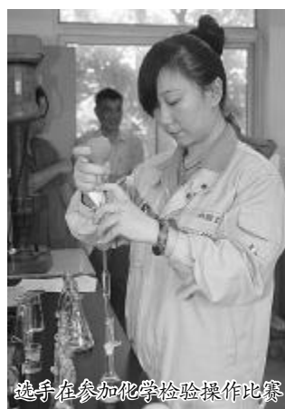
选手在参加化学检验操作比赛

此次竞赛,以增强广大职工的爱岗敬业精神,提高职工技能水平和业务素质为目标,充分发挥职业技能竞赛工作在培养、选拔和激励等方面的作用,激发公司技术工人学习技术、钻研业务的热情和营造重视技能、尊重技能人才的氛围。