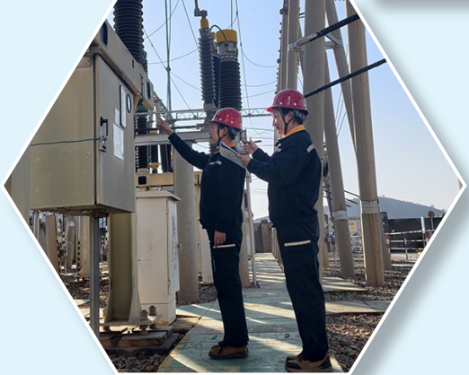
图为凉山矿业动力作业区变电站人员进行班中巡检。