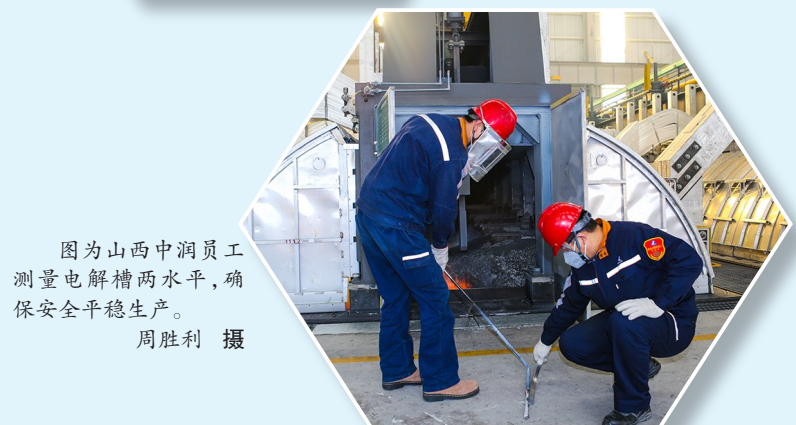
图为山西中润员工测量电解槽两水平，确保安全平稳生产。