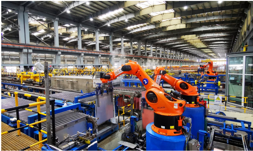
图为西南铜业高纯阴极铜生产线。

中国铜业以三年降本计划3.0为牵引，细化方案分工、明确责任主体，按月跟踪督导，构建“一盘棋”推进格局，通过打破部门壁垒，搭建“产供销储运财”一体化协同机制，实现从“单点优化”到“系统协同”的转变。 中国铜业锚定“行业一流”与“历史最优”双标杆，构建分类分层的全方位对标体系，以精准对标找差距、补短板、促提升，从产量效能、劳动效率、单耗水平、采购价格、综合回收能力五个维度建立关键指标的量化体系。 所属上市公司及二级企业围绕