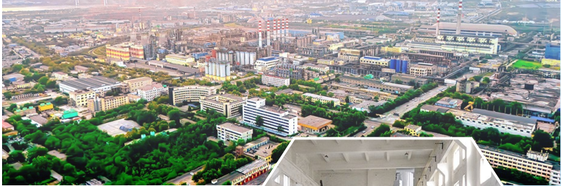
▲图为山西新材料厂区俯瞰图。

在赤泥脱碱方面，山西新材料通过精准核算优化流程，攻克多个难题，投用后工艺参数达到实验室标准。此外，利用闲置种分槽延长分解时间、制定蒸发