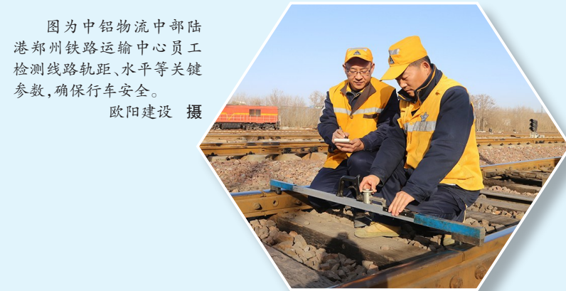
图为中铝物流中部陆港郑州铁路运输中心员工检测线路轨距、水平等关键参数，确保行车安全。

本报讯 岁末年初，中铝集团各单位层层压实安全生产责任，夯实安全生产根基，全力提升本质安全水平，守牢安全防线，护航高质量发展。