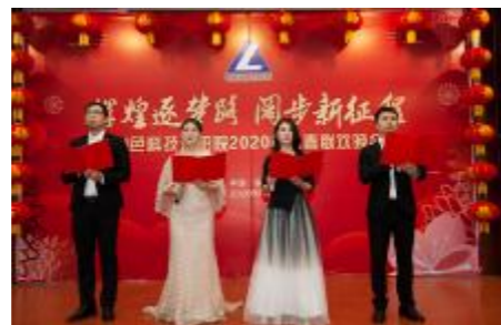
诗朗诵《绚烂往日 有色未来》