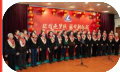
大合唱《阳光路上》《我和我的祖国》