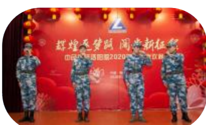
小合唱《战友还记得吗？》