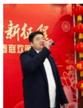
男生独唱《再一次出发》