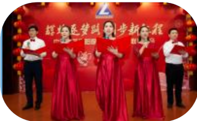
诗朗诵《有色院，我们的梦想和家园》