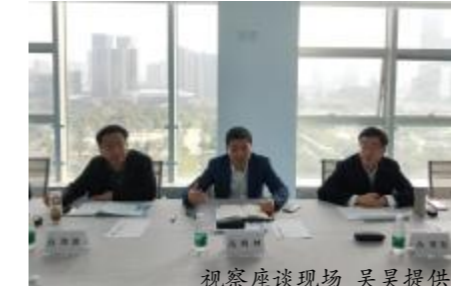
视察座谈现场

吴昊 报道 1月15日,中铝集团党组书记、董事长姚林到洛阳佛阳装饰中铝海外广州南沙办公楼装修项目进行视察。中铝集团党组副书记敖宏,党组成员、副总经理陈琪一同视察。