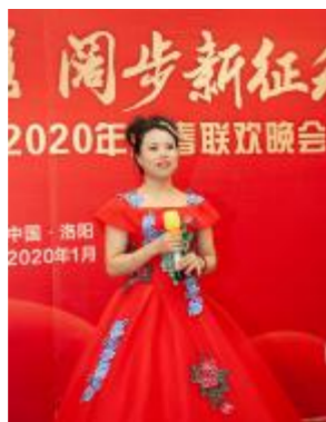
女生独唱《我的中国梦》