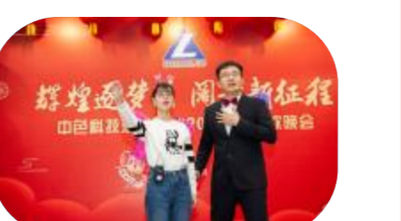
小品《我们都是追梦人》