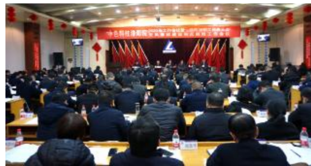
会议现场

李振强 报道 1月21日,中色科技洛阳院召开 2020 年工作会议暨一届四次职工代表大会、党风廉政建设和反腐败工作会议,并传达学习中铝集团和板块公司 2020 年工作会议和党风廉政建设和反腐败工作会议精神。中色科技党委书记、董事长、洛阳院执行董事黄粮成作了题为《坚守初心担使命 不负韶华再出发 努力谱写扭亏脱困创新发展新篇章》的讲话。中色科技总经理、党委副书记、洛阳院总经理罗爱华作了题为《真抓实干 奋勇拼搏 坚决夺取扭亏脱困攻坚战根本性胜利》的工作报告。中色科技党委副书记、纪委书记张浩作了题为《聚焦职责使命 突出政治监督 为公司扭亏脱困取得根本性胜利提供坚强保障》的党风廉政建设和反腐败工作报告。会议由副总经理、工会主席姜建亭主持。公司领导班子成员秦建平、袁南天、王小波出席会议。