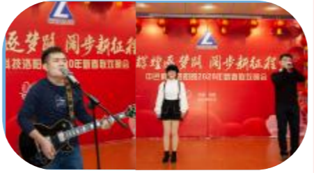
歌曲串烧《老歌新唱 浏阳河》《故乡》