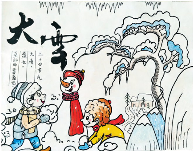
大雪 漫画 云铝清鑫 解小煊