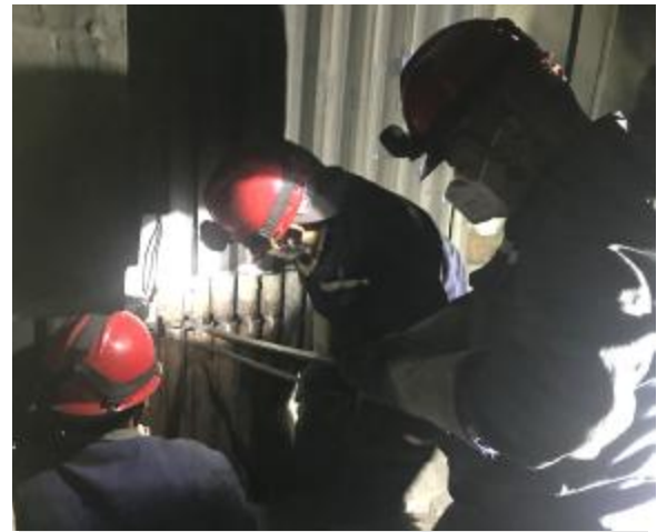
随着热电分厂7号锅炉超低排放改造工作进入尾声,近日,锅炉工区对水冷壁、省煤器等部位进行重点检修。为确保检修质量,工区派专人紧盯现场安全和工期,全面检查渗漏处,共更换6根水冷管,为7号锅炉长周期运行打下坚实基础。图为检修人员正在调整水冷管。

箱、气控柜进行防冻保温处理,确保电解槽稳定运行。维修车间对分厂供水、供风管网系统进行全面排查,做好保温防冻措施;对各种仪表进行检验,确保仪表计量的准确。分厂还组建了防冻应急队伍,出台“冬季五防”措施,为冬季电解生产的平稳高产保驾护航。(闫学温)