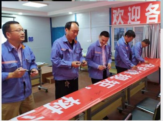
►图为六冶云南分公司宁永总承包管理部举行反腐倡廉签字承诺活动。