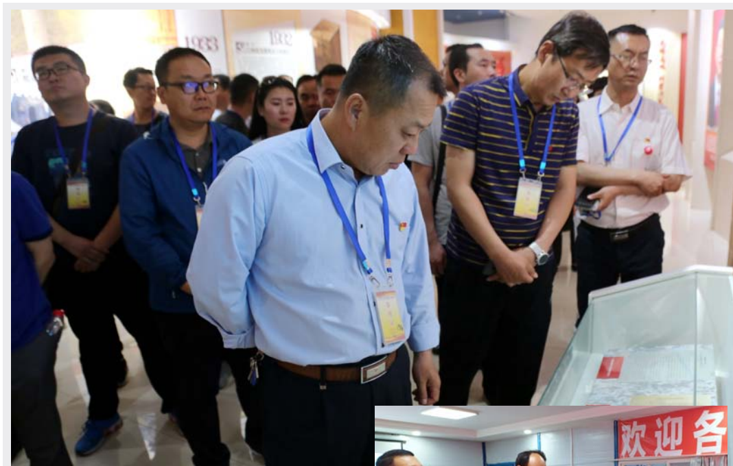
▲图为宁夏能源马莲台发电厂纪委组织党员干部、重点岗位人员赴宁夏回族自治区廉政警示教育中心参观,接受廉政警示教育。